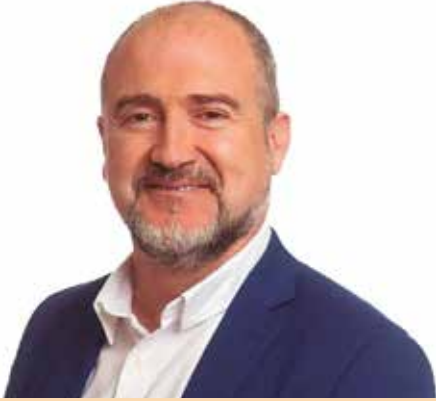
Alfredo Clúa Alcalde de Cambrils